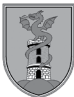
Kozje dvonogi krilati zmaj