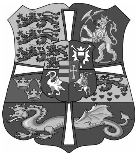
Kraljevski grb Norveške in Danske 1559-1699

Danski kralj Christian I. ima od leta 1440 v svojem kraljevskem grbu krilatega venetskega zmaja [9] – Kalmarska zveza. Uradno je postal danski kralj leta 1448, kasneje, leta 1457 je postal še švedski kralj. Od tedaj se nahaja kronani venetski zmaj v kraljevskem grbu, kar govori o kraljestvu Vinedov . Danski kralj ali kraljica sta še danes uradno kralj ali kraljica Vinedov naših prednikov in s tem tudi Slovencev!