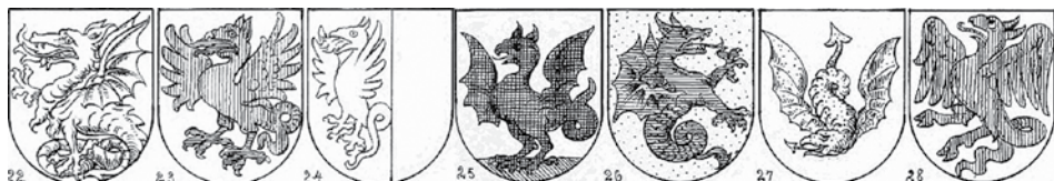
Zmaji od števila 22 do 28 so iz knjige [16].

Zanimiv kraj je Ennetemoos/Švica. Ime daje vtis, da je nastalo iz (V)enet(ski) Mah, kakor ‚mah‘ še danes npr. na Vrhniki pri Ljubljani imenujejo barje, močvirje. Nem. beseda Moos pomeni isto, tj. mah. In kraj ima tudi dvonovega krilatega zlatega zmaja!