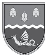
Žiri štirinogi krilati zmaj