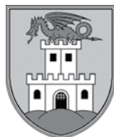
Ljubljana štirinogi krilati zmaj