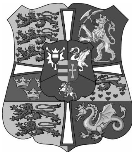
Kraljevski grb Norveške in Danske 1699-1819

Značilen ščit z grbi okoli let 1559 – 1699 predstavlja kraljevske naslove; prvo polje: Danska, drugo polje: Norveška, tretje polje: Kalmarska zveza – Švedska, četrto polje: kralj Gotov, vznožje ščita: kralj Vinedov – kronani dvonogi krilati zlati zmaj z razcepljenim jezikom in s po štirimi kremplji na vsaki nogi, na škrlatnem polju, na koncu repa puščičasta konica, sredina ščita predstavlja knežje naslove – Schleswig, Holstein, Stormarn in Dithmarschen, srčni ščit pa predstavlja dinastijo Oldenburg – Oldenburg in Delmenhorst.